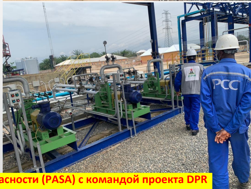
Во время предстартового аудита безопасности (PASA) с командой проекта DPR