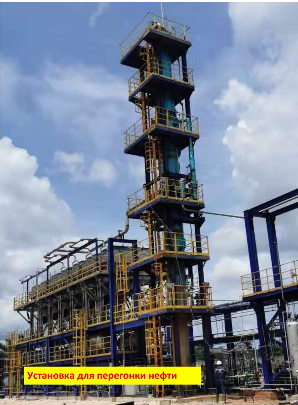
Установка для перегонки нефти