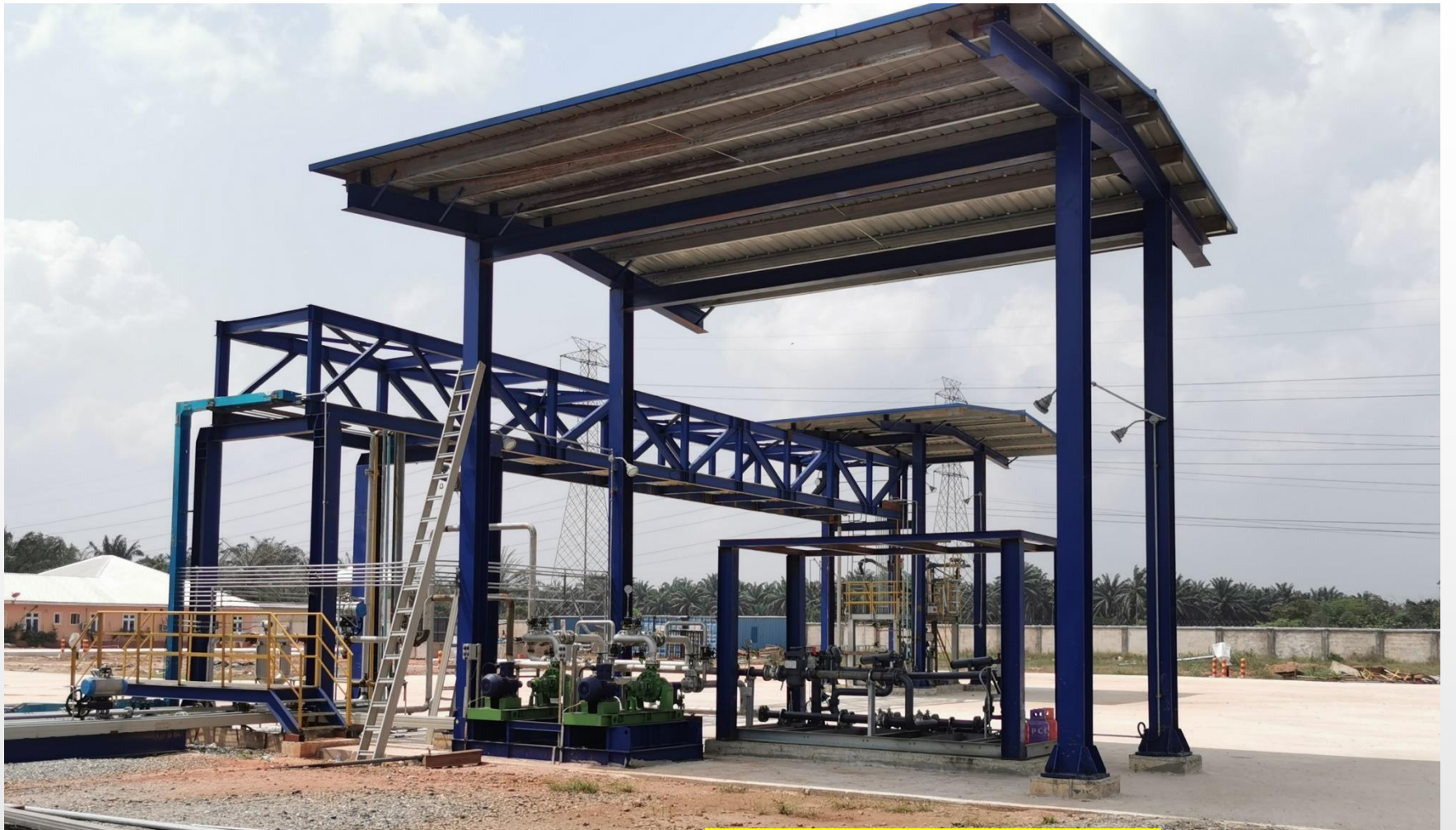
Платформа для загрузки продукта