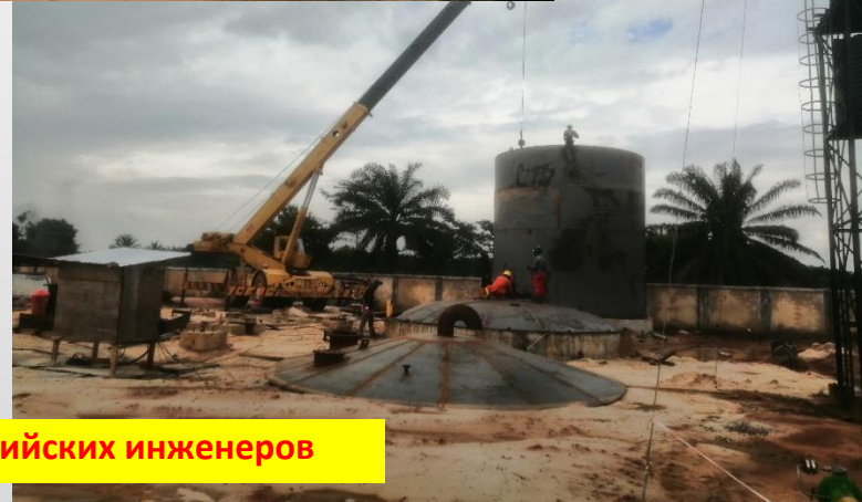
Комплекс монтажных работ с привлечением обученных нигерийских инженеров