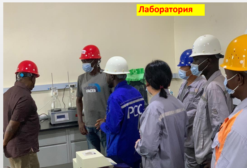
Визит правительственной делегации во главе с Федеральным министерством